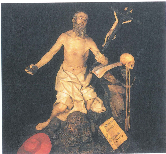
Francisco SALZILLO: San Jerónimo .